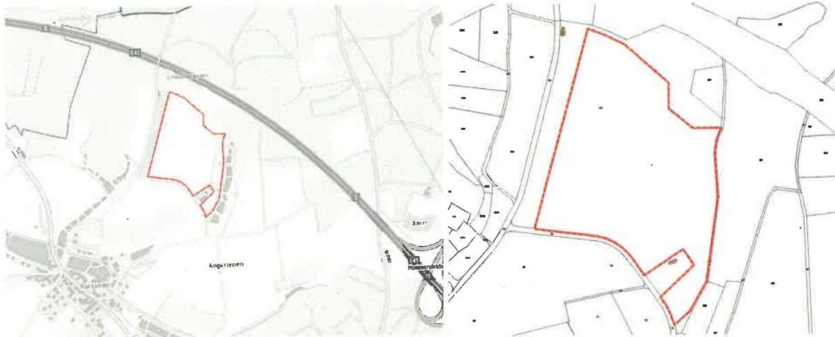
LAGEPLAN – ohne Maßstab

Der Geltungsbereich des Bebauungsplans umfasst eine Teilfläche des Grundstückes Fl.Nr. 1059, Gemarkung Schirnsdorf. Er liegt zwischen Nackendorf und der Autobahn BAB3.